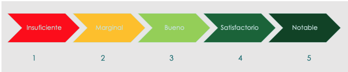
Figura 2 Escala de valoración del desempeño