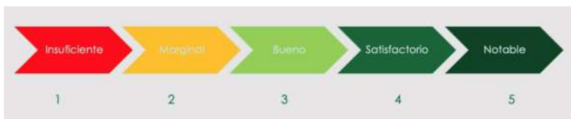
Figura 2 Escala de valoración del desempeño

La estimación del desempeño o grado de cumplimiento, así como su valoración cualitativa, para cada nivel de objetivo en la Matriz de Indicadores de Resultados del Fondo, correspondientes a las preguntas de evaluación A1, A2, A3 y A4 (véase Tabla 4), se realiza exactamente de la misma manera descrita anteriormente. De esta manera se obtiene valoraciones del desempeño específicas para cada nivel de objetivo y de manera general.