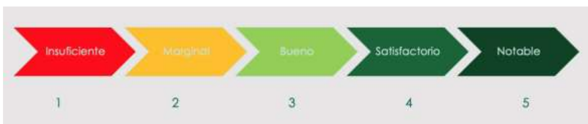
Figura 2 Escala de valoración del desempeño

La estimación del desempeño o grado de cumplimiento, así como su valoración cualitativa, para cada nivel de objetivo en la Matriz de Indicadores de Resultados del Fondo, correspondientes a las preguntas de evaluación A1, A2, A3 y A4 (véase Tabla 4), se realiza exactamente de la misma manera descrita anteriormente. De esta manera se obtiene valoraciones del desempeño específicas para cada nivel de objetivo y de manera general.